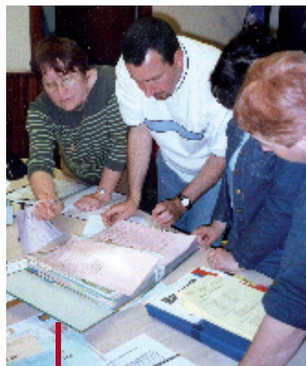
Une organisation simple, les études de cas