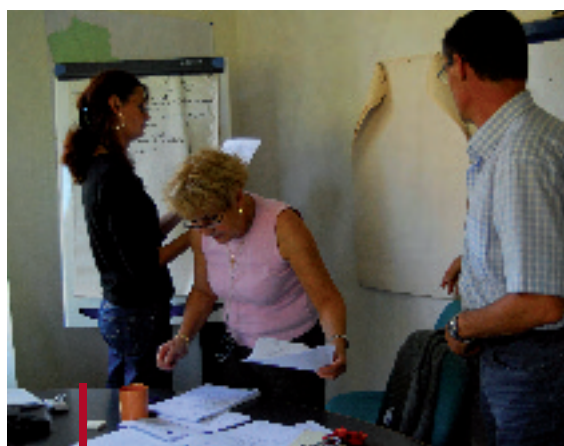
"Exercice de cadres simple" pour entraîner les membres du P.C.C.